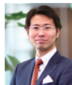
第92回経営戦略セミナー 経営研究会全国大会 総合プロデューサー